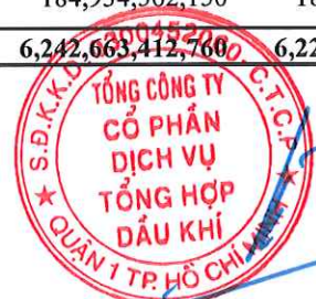
Phùng Tuấn Hà Chủ tịch HĐQT

Các thuyết minh từ trang 6 đến trang 21 là một bộ phận một hợp thành của báo cáo tài chính hợp nhất